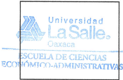
SELO DE LA DEPENDENCIA