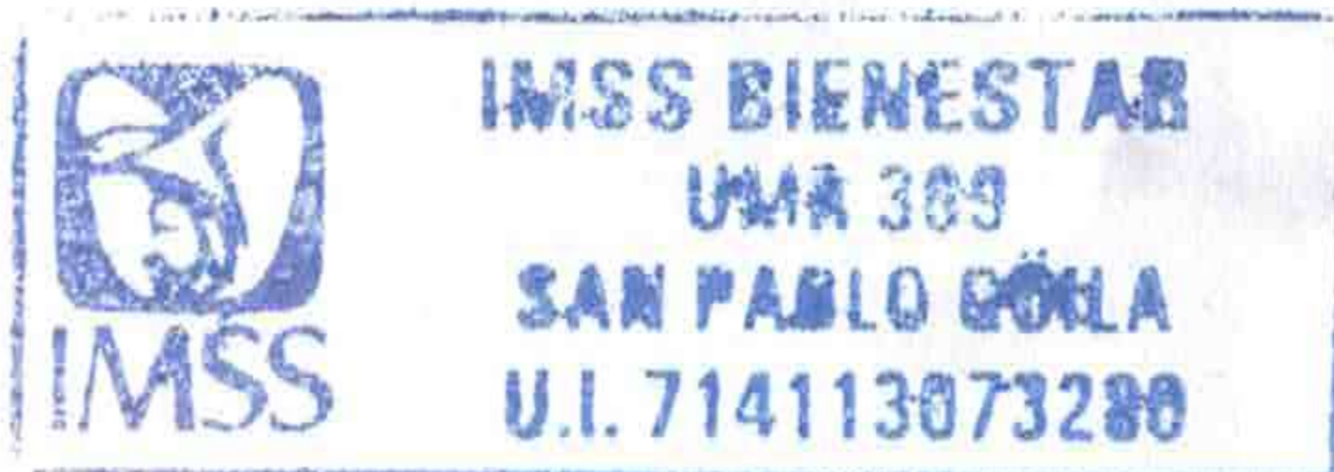
SELLO DE LA DEPENDENCIA VISITADA