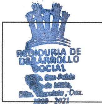
SELLO DE LA DEPENDENCIA