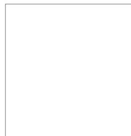
SELLO DE LA DEPENDENCIA

_____ NOMBRE CARGO Y FIRMA DE LA AUTORIDAD O DEL TITULAR DE LA DEPENDENCIA