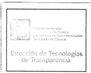
SELLO DE LA DEPENDENCIA